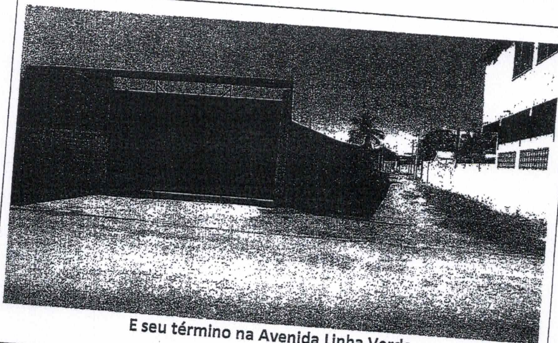
E seu término na Avenida Linha Verde